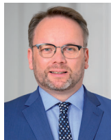
Ihr Timon Gremmels

Hessischer Minister für Wirtschaft, Energie, Verkehr, Wohnen und ländlichen Raum