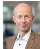
Ihr Armin Schwarz

Hessischer Minister für Wissenschaft und Forschung, Kunst und Kultur