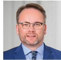
Timon Gremmels Hessischer Minister für Wissenschaft und Forschung, Kunst und Kultur