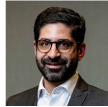
Kaweh Mansoori Hessischer Minister für Wirtschaft, Energie, Verkehr, Wohnen und ländlichen Raum

Wer dual studiert, profitiert von optimalen Studienbedingungen, sammelt wertvolle Praxiserfahrungen und verschafft sich durch die enge und frühzeitige Einbindung in ein Unternehmen beste Chancen auf eine Übernahme nach dem Abschluss. Und je nach Modell ist parallel sogar ein dualer Berufsausbildungsabschluss möglich.