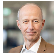
Armin Schwarz Hessischer Minister für Kultus, Bildung und Chancen

Viele Informationen unter www.dualesstudium-hessen.de