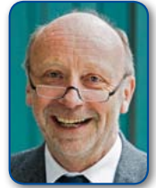
Dieter Posch, Hessischer Minister für Wirtschaft, Verkehr und Landesentwicklung