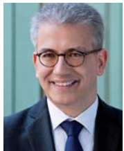
Ihr Tarek Al-Wazir

Investitionen in Bildung zahlen sich aus. Das stellen die Hochschulen und Berufsakademien in Hessen täglich aufs Neue unter Beweis, indem sie mit der wissenschaftlichen Ausbildung junger, talentierter Menschen die Zukunftsfähigkeit unseres Landes sichern. Unter der Dachmarke Duales Studium Hessen bieten Hochschulen und Berufsakademien eine wachsende Palette dualer Studienangebote, die in besonderer Weise berufsspezifischen Qualifikationsprofilen der Wirtschaft gerecht werden. Sie bilden in enger Zusammenarbeit mit Praxispartnern qualifizierte Fachkräfte aus, die mit fundiertem Methodenwissen und praktischer Erfahrung das Beste aus zwei Welten mitbringen.