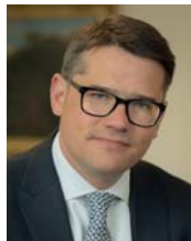
Ihr Boris Rhein

Hessischer Minister für Wirtschaft, Energie, Verkehr und Landesentwicklung